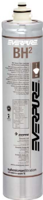
BH 2 Filterpatrone: 9612-51

Liefert Premiumwasser höchster Qualität für Kaffeeanwendungen